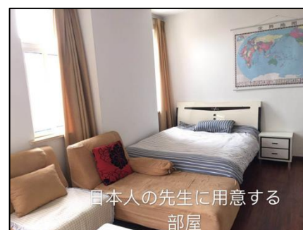
日本人の先生に用意する 部屋

「研修事前教育ガイドライン」を基に作成。 指導計画、カリキュラムに関しては、赴任後に派遣教師と 現地教師とで話し合い作成します。